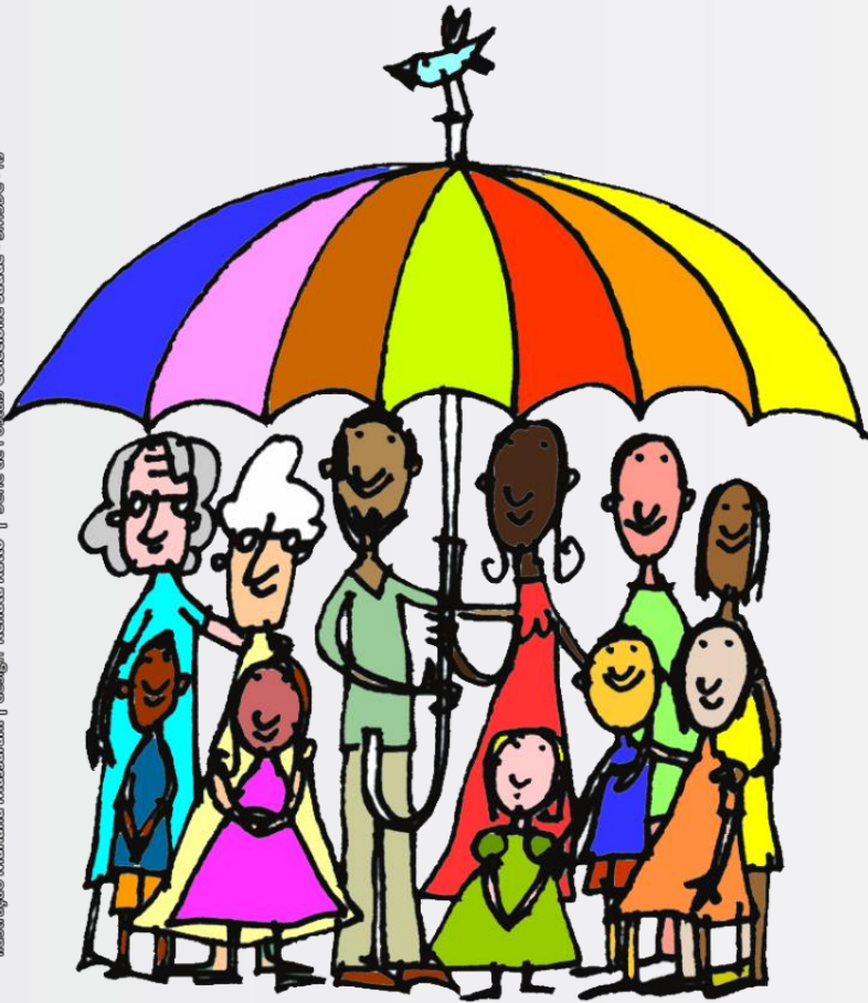
Ilustração Mariana Massarani | design Renata Ratto | Série de Postais Coleção Saúde - SIVSUC - RJ