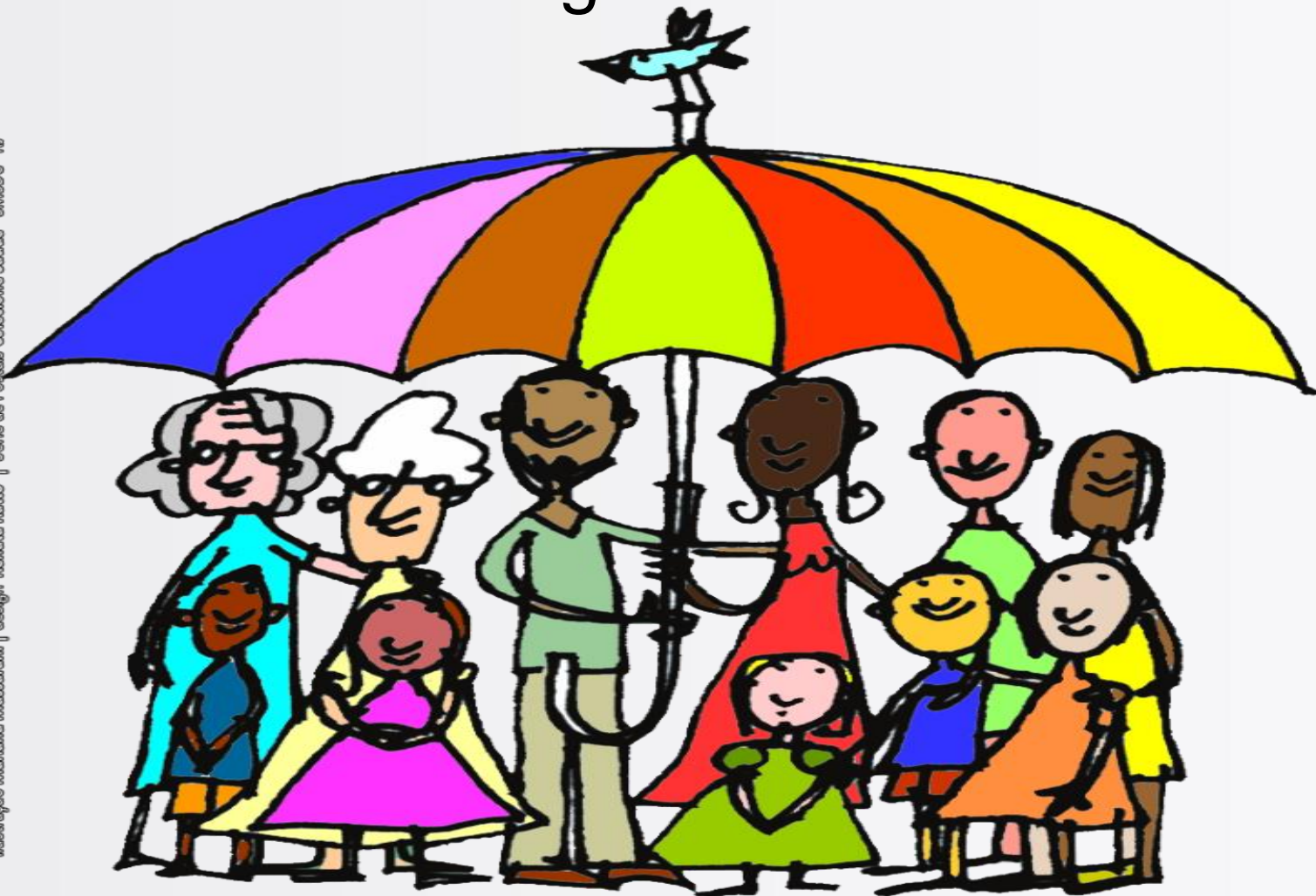
Ilustração Mariana Massarani | design Renata Ratto | Série de Postais Coleção Saúde - SMSDC - RJ